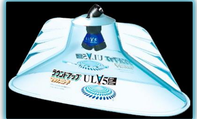
ULV5 ツインノズルと専用カバー