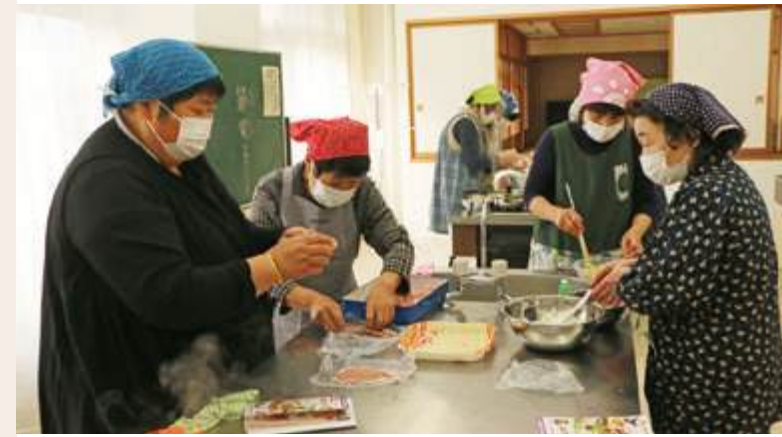
▲作業を分担しながら手際よく調理を行う部員