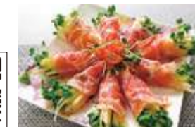
▲合格祈願! ブーケサラダ