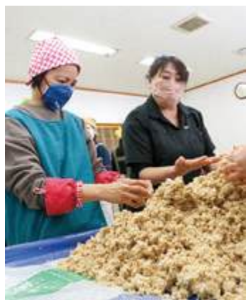
▲材料は当JA管内産大豆に菅氏宅の麹、塩の3種類を使用しています

味噌は半年から10か月ほど、空気が入らないように塩を置き、冷暗所で保存熟成することで一層美味しくできあがるとのこと、参加者は「完成が楽しみ」「早く家族みんなで味噌汁にして食べたい」と期待に胸を膨らませながら味噌を持ち帰りました。