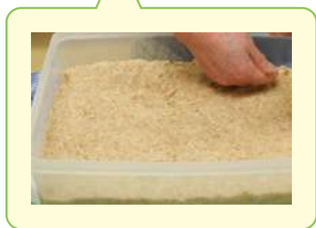
▲時間の経過とともに、少しずつ味噌の色が濃くなっていきます